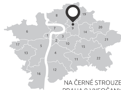
NA ČERNÉ STROUZE PRAHA 9-VYSOČANY

Bydlení v projektu VÝHLEDY ROKYTKA je příležitostí pro ty, kteří chtějí být na dosah centra, a přitom využívat všech výhod bydlení v klidu a zeleni vedle nově vznikající moderní části města. V okolí v poslední době vznikly a vznikají nové bytové, obchodní a administrativní objekty. V příštích několika letech se počítá s velkorysou revitalizací okolí stanice metra B Kolbenova a s další nabídkou služeb a významným rozšířením občanské vybavenosti.